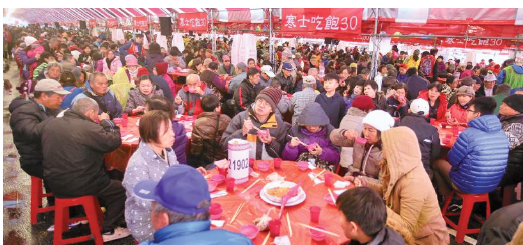
創世、華山、人安基金會共同舉辦的「第28屆寒士吃飽30尾牙」活動，4日在總統府前廣場登場，數萬人參與，場面盛大。

陳副總統指出，當大家攜手同心一起做好事，就會像漣漪一樣不斷擴散，也將過去大家喜歡陳抗抗的地方，變成有溫暖、有愛的地方。未來大家攜手合作，可以讓國家更美好、溫暖。 前總統馬英九也到現場致詞並發放紅包，馬英九說，寒士尾牙活動28年來已辦桌超過2.8萬桌，服務寒士近30萬人，贊助人就有4萬人，讓人感動，「台灣愛心非常了不起」，雖然天冷，但贊助人就像是「暖士」，溫暖大家。 台北場寒士尾牙席開2200桌，除有熱呼呼的團圓飯，還可領到紅包以備急用，讓寒士感受社會溫馨。其他縣市在設有平安站的據點也同步辦理共3690桌，邀請寒士、街友、單親媽媽、獨居長輩等近4萬人參與。